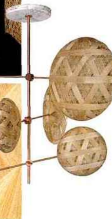
Suspension en abaca, cuivre et marbre. Abaca, copper and marble lamp. Chanpen , design Anon Pairot, FORESTIER.