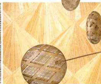
Revêtement mural en fibres de paulownia. Paulownia wall covering. Quintessence , NOBILIS.