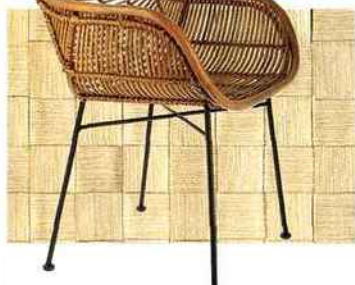
Papier peint en tressage de viscose. Viscose wallpaper. Collection Somé&Ori , KOJIMA à l'Atelier des Blancs Manteaux. Fauteuil en rotin et fer forgé. Rattan and wrought iron armchair. Collection Vintage , COMPAGNIE FRANÇAISE DE L'ORIENT ET DE LA CHINE.