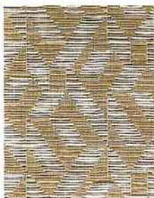
Revêtement mural en fibres synthétiques. Synthetic wall covering. Folies , OASAMANCE.