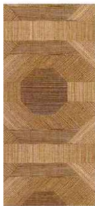
Papier peint. Wallpaper. Metric , collection Oculaire , ARTE.

Natural weaves envelop the viewer with golden- tinged highlights.